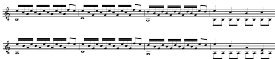
FIGURA 8 – Transcrição de um trecho da música “Top Gear”. Essa transcrição pode ser tocada em um instrumento harmônico como o violão.

Na Figura 8, finalmente, mostramos uma transcrição de alguns compassos do tema de “Top Gear”, um conhecido jogo de videogame da década de 1990. Ainda hoje é possível constatar que esse tema é bastante popular. Em consulta pelo canal do Youtube, identificamos diversas adaptações desse tema em variadas formações instrumentais, todas muito acessadas.