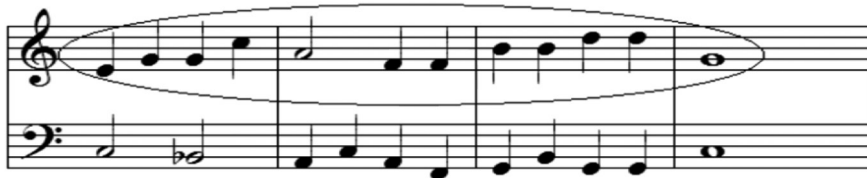
FIGURA 5 – Exercício de contraponto sobre tema folclórico brasileiro.

Na Figura 4 mostramos um trecho de um exercício musical com duas melodias simultâneas. Trata-se de um exercício formal onde são utilizadas pequenas escalas musicais. Trecho extraído dos exercícios de contraponto de Fux (1971, p. 50).