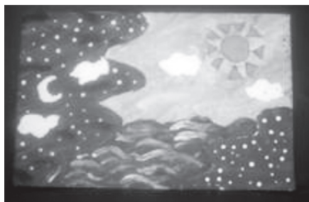
FIGURAS 1 e 2 – Fotos de quadros em tela, produzidas pelos alunos da Escola nas atividades da disciplina de Artes)

O trabalho com a cultura local permite explorar a dança, a música, o teatro e a pintura; através de encenações sobre o folclore, as lendas e costumes locais, como as quadrilhas juninas, as principais celebrações festivas (páscoa, dia das mães, dia das crianças,