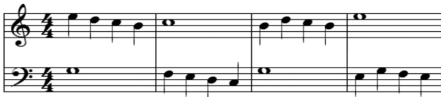
FIGURA 4 – Trecho de exercício de contraponto proposto por Johan Fux.

clóricos em acordo com Maciel (1996) ou mesmo desenvolver uma pequena composição juntamente com os alunos.